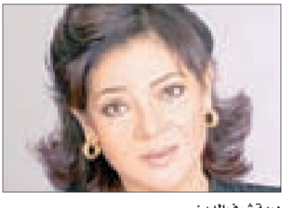
دورية شرف الدين

كتبت: حاتم جمال الدين: أعدت وزارة الإعلام خطة لاستكمال الأعمال الدرامية المتوقفة وايضا المشاركة في أعمال درامية جديدة خلال الفترة المقبلة بهدف استعادة دور مصر في مجال الدراما التي تمثل إحدى القوى الناعمة للدولة. وكانت د. درية شرف الدين وزيرة الإعلام قد عقدت اجتماعا ضم عصام الأمير رئيس اتحاد الإذاعة والتلفزيون، وحسن حامد رئيس مدينة الإنتاج الإعلامي، وسعد عباس رئيس شركة صوت القاهرة، وعادل ثابت رئيس قطاع الإنتاج ومستوطني الإنتاج بالقطاعات الثلاثة، حيث ناقش الاجتماع أسباب توقف الإنتاج الدرامي وعدم استكمال مجموعة من المسلسلات والتي بدأ تصويرها منذ فترة طويلة. ناقش الاجتماع نقص مصادر تمويل الأعمال الدرامية وخطة الإنتاج المقترحة من القطاعات الإنتاجية الثلاثة والتي تعانى من نقص حاد في التمويل أدى إلى توقف العديد من المسلسلات. وأكدت وزيرة الإعلام ضرورة استكمال الأعمال المتوقفة والبدء في خطة تسويقية لها في موسم عرض شتوي، وأهمية المشاركة مع القطاع الخاص في أعمال جديدة خلال الفترة القادمة. وأشارت وزيرة الإعلام إلى أهمية الدراما في نشر الثقافة والحرص على اختيار موضوعات تعبر عن قضايا المجتمع وتميز إنتاج جيد قادر على المنافسة في السوق العربية وذلك بالمشاركة مع شركات القطاع الخاص. وسوف تبدأ شركة صوت القاهرة في استكمال مسلسل «الحكر»، وكش ملك، حيث قاربت على الانتهاء من تصويرها بعد البحث عن سبل تدبير مصادر تمويل رغم الصعوبات الحادة التي تواجهها القطاعات الإنتاجية الثلاثة.