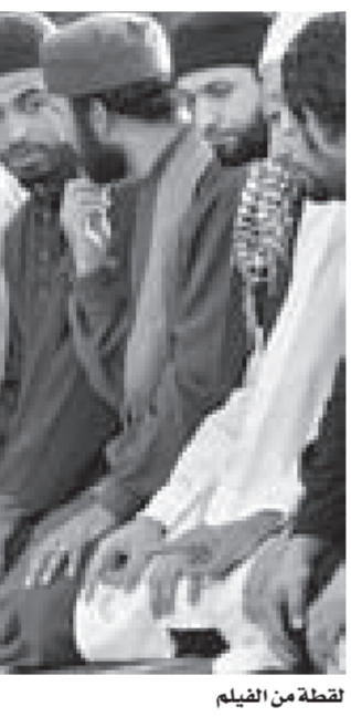
لقطة من الفيلم