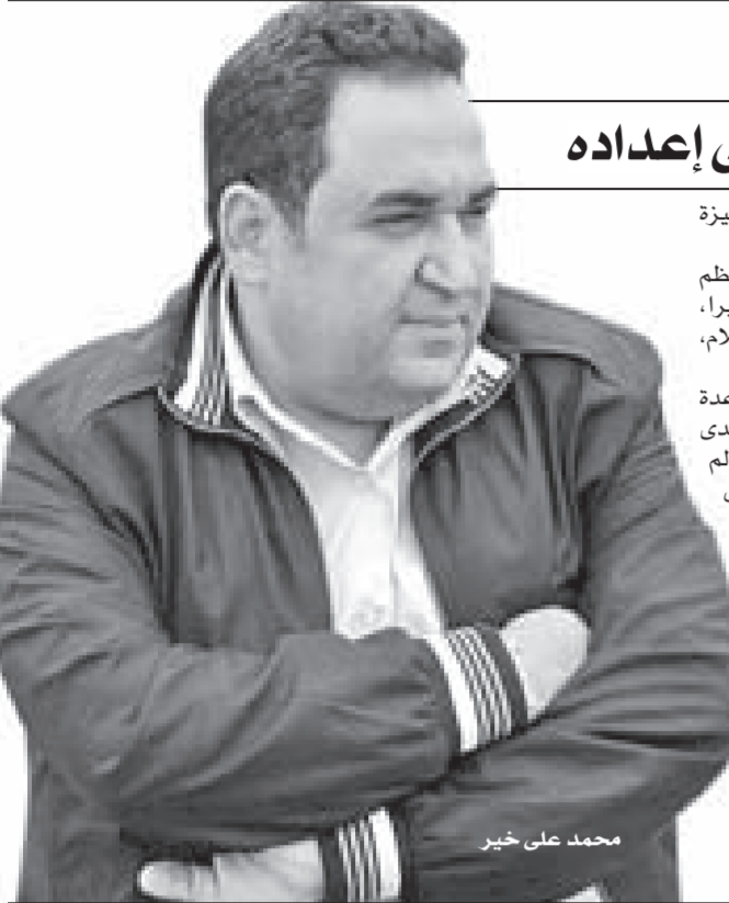
محمد على خير

برنامجى توك شو تنويرى يفتح الباب لمشاركة ٨٥ مليون مصرى فى إعدادة